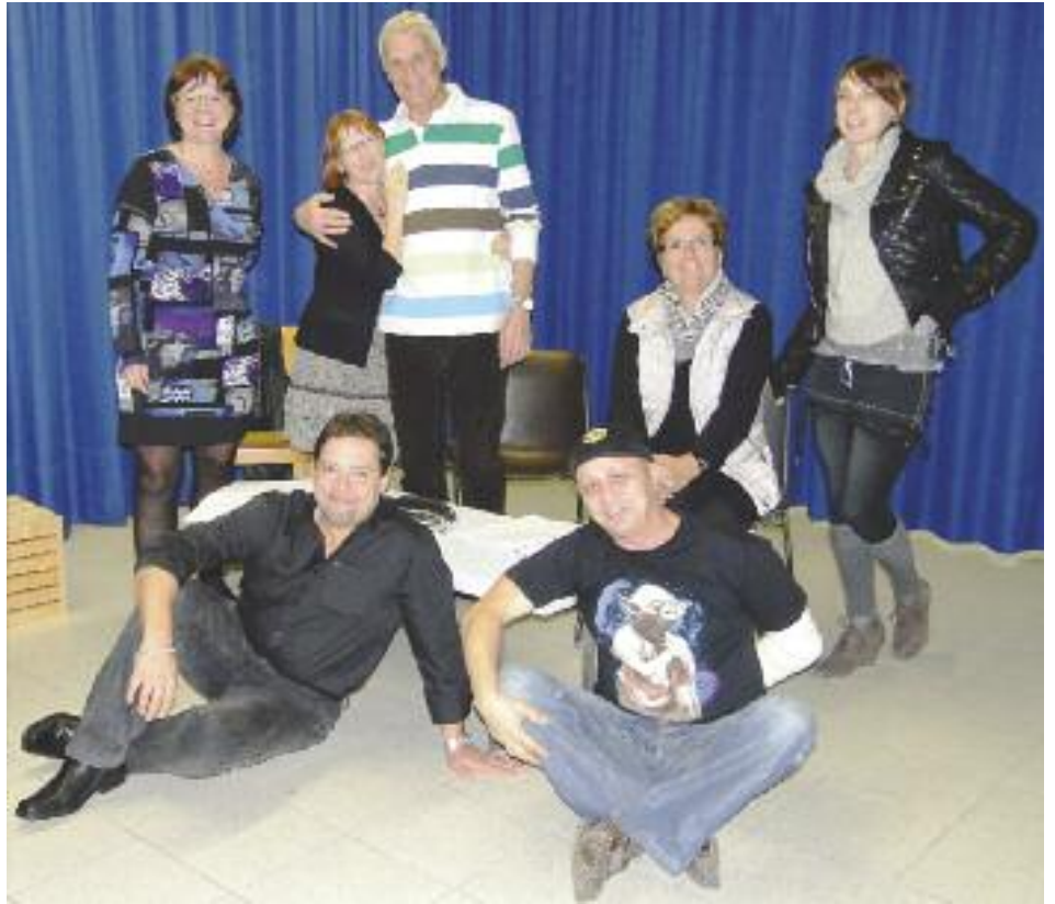
Quelques acteurs en pleine répétition.

«Pauvre mère Bertine... A la veille de quitter notre monde, elle a chargé son amie Colette de réunir autour d'elle ses enfants et leurs conjoints. Rassemblant les forces qui lui restent, elle entend dicter ses dernières volontés, quelque peu farfelues, il est vrai.